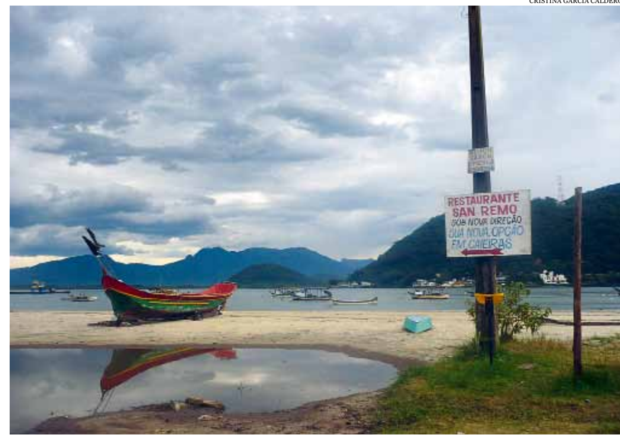
Morada de pescadores, la pintoresca Bahía de Guaratuba en el Litoral de Paraná.